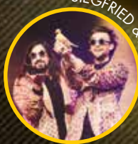
SIEGFRIED & JOY (DE)